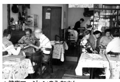
▲健康マージャンのみなさん