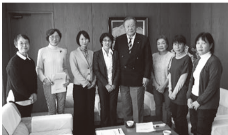
一言提案(右記)も参考にまとめた予算要望書(詳細はHP)を提出