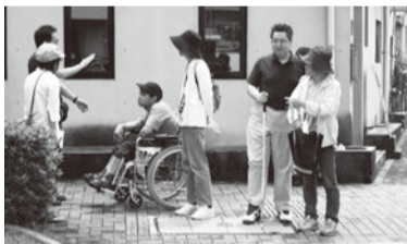
バリアフリー調査